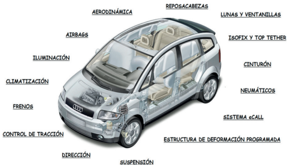
Figura 3. Sistemas del vehículo que han sido influenciados por la electrónica (Artero, 2016)

Varias de las funciones mecánicas han sido sustituidas por componentes electrónicos, entre las más importantes existen: la sustitución de sistemas mecánicos e hidráulicos por componentes eléctrico/electrónicos (E/E) se describe con el término genérico "X-by-wire" (Leen & Heffernan, 2002). Se ha identificado el reemplazo de más de nueve funciones vinculadas con la aceleración, el frenado, el cambio de velocidades, la suspensión, la integración encendido/alternador, el control variable de válvulas, el convertidor catalítico, los dispositivos eléctricos, así como con otros accesorios eléctricos. Todos ellos generan señales que van a diferentes microprocesadores dedicados que toman decisiones para la operación del vehículo. Entre los principales desafíos de la electrónica del automóvil está su robustez para soportar las exigencias dinámicas a las que está sometido el vehículo, así como a los requerimientos de exigentes condiciones ambientales de operación. En la Figura 3 pueden apreciarse los diferentes sistemas del vehículo que han sufrido modificaciones e innovaciones debido a la implementación de la electrónica.