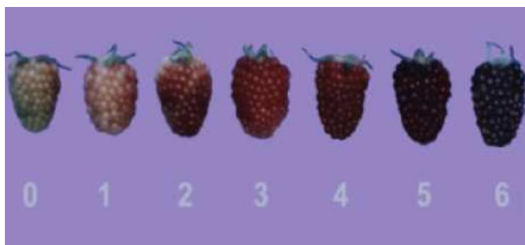
Figura 1. Escala de color de la mora de castilla (NTC 4106, 1997 ; NTE INEN 2 427, 2010)

La medición del color puede ser realizada de forma visual a través de una codificación numérica para cada estado de madurez, como se muestra en la Figura 1 en base a los requisitos de (NTE INEN 2 427, 2010), o instrumental a través de colorímetros triestímulo (colorímetros Hunter Lab) o a través de coordenadas rectangulares adimensionales ( L^* , a^* , b^* ) junto con otro de coordenadas cilíndricas ( L^* , H^* , C^* ) y visión digital. El profesor Albert Munsell estableció la ciencia del color y la definió técnicamente con 3 atributos: matiz (tono, tinte, color “ hue ”), croma (saturación, intensidad, pureza “ chroma ”) y brillo (brillante, brillo “ brighthness ”) (Retting & Ah-Hen, 2014).